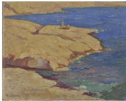
Μιχάλης Οικονόμου, Θαλασσινό τοπίο (1920 – 1926)

Σημείωση: Για τον σχολιασμό των πινάκων ζωγραφικής καλό θα είναι να έχει προηγηθεί συζήτηση όπου, μέσω ερωτήσεων που θέτει ο/η εκπαιδευτικός, οι μαθητές/τριες θα έχουν εξοικειωθεί α) στο να παρατηρούν έργα τέχνης (Τι βλέπετε / Τι παρατηρείτε στον πίνακα;), Τι νομίζετε ότι συμβαίνει στον πίνακα; (ενεργοποίηση σκέψης), Υπάρχουν απορίες που σας γεννώνται βλέποντας το έργο; Τι περισσότερο θα θέλατε να μάθετε; (εμβάθυνση).].